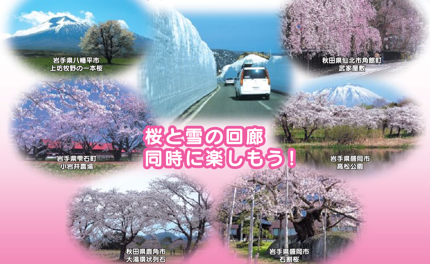
岩手県八幡平市 上坊牧野の一本桜