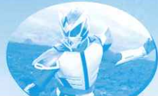
◎当地ヒーロー 岩壁護神ハチマンタイラー