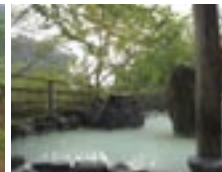
松川温泉峽雲荘 自家源泉ですべての風呂が源泉掛け流しの宿