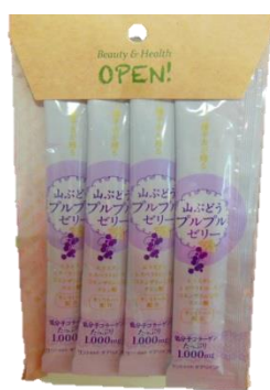
山ぶどうプルプルゼリー 15g × 7包 ¥1,140