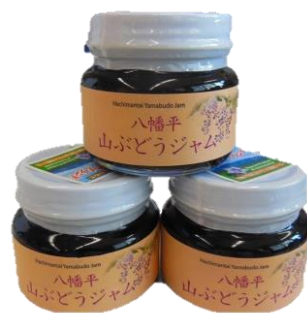
八幡平山ぶどうジャム 150g ¥540

【お問い合わせは八幡平市観光協会 TEL.0195-78-3500 までどうぞ】