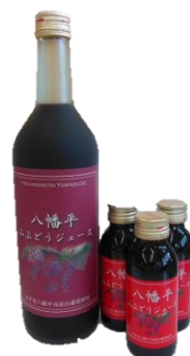
八幡平山ぶどうジュース (大)720ml (小)100ml ¥1,620 ¥330