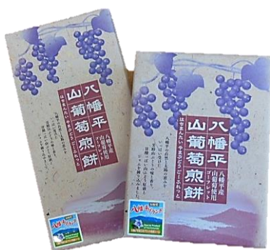
山葡萄煎餅 10枚入 / 18枚入 ¥1,080 ¥650