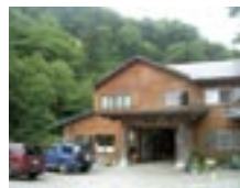
松川温泉松楓荘 岩風呂をはじめとした各種露天風呂がある