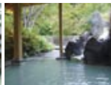
松川温泉松川荘 ロック風の外觀と広い露天風呂の宿