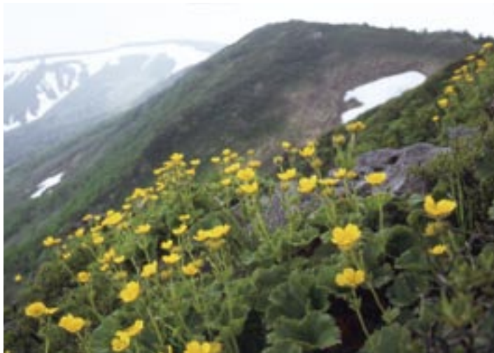
源太ヶ岳に咲くミヤマキンポウゲ

アスピーテラインをはさんで八幡平と対峙する裏岩手連峰。観光客であふれかえる八幡平とはうってかわって静かな山歩きが楽しむことができる。歩行時間が長いので準備を怠らないように。