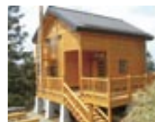
大深山荘 大深岳北面、標高1420mの無人小屋。通年開放

日本百名山の八幡平と岩手山を間近に望む藤七温泉は東北最高所の一軒宿。松川温泉は松川沿いにある山あいのいで湯。4軒の宿が静かに湯煙を上げて出迎えてくれる。ふたつの温泉を結ぶ縦走路にも2軒の避難小屋があり、トレッキングの強い味方になってくれる。