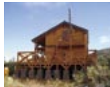
ミツ石山荘 ミツ石湿原、標高1300mの無人小屋。通年開放