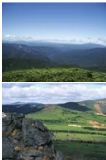
上/縦走路からの秋田県側の眺望 下/広々としたミツ石湿原

滝ノ上温泉、犬倉駅への道を分け、バス停のある松川温泉へ下る。松川温泉には4軒の宿があり、入浴のみの利用もできるのでバスの待ち時間に立ち寄るのもよし、一泊してのんびり縦走の疲れを癒すのもいだろう。