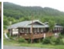
ペンションアルペンローゼ 温泉を利用した染色体験ができる