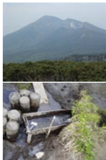
上/縦走路からは秀麗な山容の岩手山を望む 下/大深山荘近くの水場