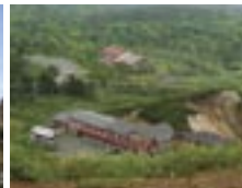
藤七温泉彩雲荘 標高1400mの温泉宿。貸し切りの露天風呂がある