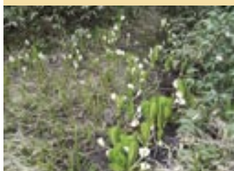
大深山荘の湿原に咲くミスバショウ。このあたりはキヌガサソウなど花が多い

大深山荘から大深岳へ向かうと分岐になるので、左に入る。ハイマツの稜線をたどると展望のよい源太ヶ岳。山頂からはお花畑のなかを下って行く。ブナ林を抜けると松川温泉バス停に着く。